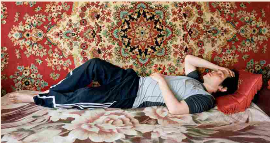
Attivi da sdraiati. Un'immagine della serie «I, Oblomov» realizzata dal giovane fotografo Ikuru Kuwajima ed esposta dal 20 aprile al 23 maggio al «Photobookfest 2018», il festival internazionale di fotografia contemporanea di Mosca

C hi me l'aveva dato da leggere quand'ero ventenne voleva certamente vaccinarci da un vizio che sinceramente non ho mai praticato, l'ultimo dei sette peccati capitali, cioè la pigrizia. In realtà rimasi affascinato da Oblomov, il protagonista dell'omonimo romanzo pubblicato dal russo Ivan A. Gončarov nel 1859. A rendermelo gradevole era la sua naturale serenità e bontà che gli impediva di squarciare il velo dell'inerzia e del sonno per guardare il flusso turbolento degli eventi esterni e di infrangere la nebbia dorata dei suoi sogni. A scuotere quella placida quiete non riuscirà neppure il vivace vento primaverile della bella e